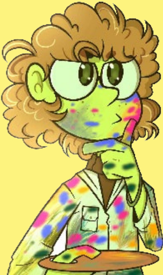
Illustrationen: Michael Götz